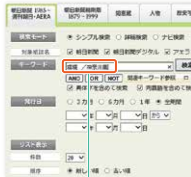
▼ シンプル検索画面

検索モードの「シンプル検索」か「詳細検索」を使います。キーワードに「&(半角)/(全角スラッシュ)+ 都道府県名」を入力して検索します。